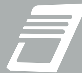
VELUX INTEGRA® termékek